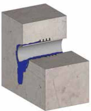
Einbausituation ohne KRASO® Dichteinsatz Typ GR