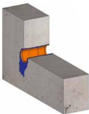
Einbausituation ohne KRASO® Wanddurchführung Typ B