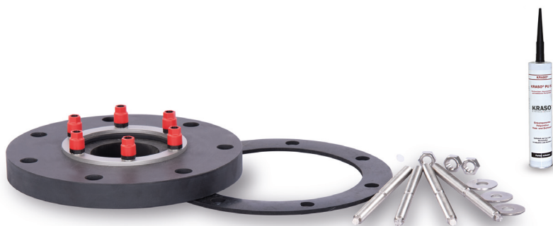
KRASO® Multiflanschplatte Typ MFP, EPDM Flachdichtung, Befestigungsmaterial, Kleb- und Dichtstoff KRASO® PU 50