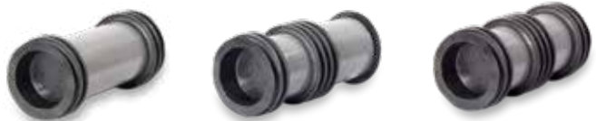
KRASO® Typ DFW/FE 4 KRASO® Typ DFW/FE 6 KRASO® Typ DFW/FE 8