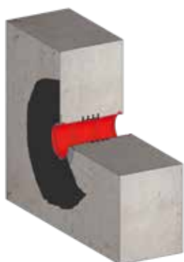
Einbausituation KRASO® Wanddurchführung Typ B/SF 4