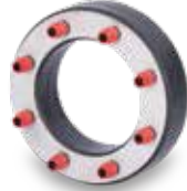
KRASO® Typ DD