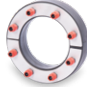
KRASO® Typ DD/T (geteilte Ausführung für den nachträglichen Einbau)