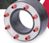
KRASO® Typ VD