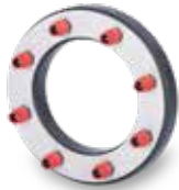
KRASO® Typ ED