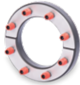
KRASO® Typ ED/T (geteilte Ausführung für den nachträglichen Einbau)