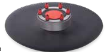
KRASO® Folienklemmflansch Typ FKF Universal

für die Abdichtung von Medien jeglicher Materialien vor einer Wand, mit Folienflansch 1,2 mm, in Anlehnung an DIN 16937, öl- und bitumenbeständig, ca. 15 cm umlaufend, 40 mm Dichtung, gegen drückendes Wasser bis 1,5 bar, DrehmomentKontrollMutter KRASO® DKM, rostfreier Edelstahl V2A