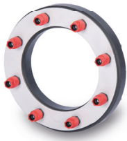
KRASO® Typ ED

KRASO® Dichteinsatz Typ ED + DD + VD Hier geht es zum Montagevideo (Einfach QR-Code scannen!)