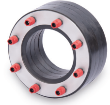
KRASO® Typ VD