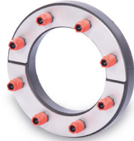
KRASO® Typ ED/T (geteilte Ausführung für den nachträglichen Einbau)