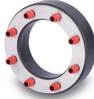
KRASO® Typ DD